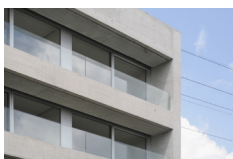
Detail der Fassade mit Brüstungen

REALISATION An einem exponierten Ort haben wir ein Projekt realisiert, das die Bedürfnisse der Bewohner und des Pflegepersonals berücksichtigt sowie an die spezielle Lage angepasst ist. Die Materialwahl vermittelt den Bewohnern Sicherheit und Geborgenheit. Öffnungen gegen Osten und Westen sowie die transparenten Brüstungen verbinden auch bettlägerige Bewohner mit der Aussenwelt. Die gewählten Materialien sind nachhaltig und unterhaltsarm.