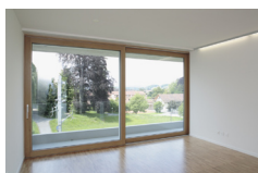
Verbindung von Innen- und Aussenraum mittels grosszügiger Verglasung