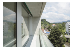
Aussicht mit Weitblick