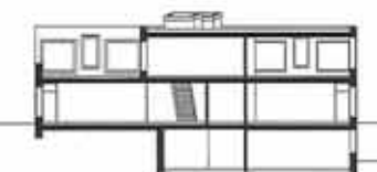
0 1 2 3