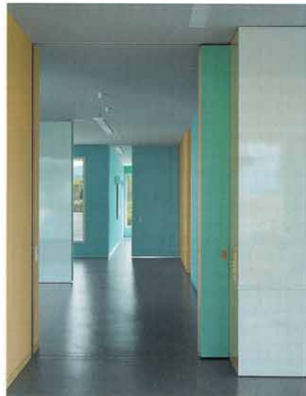
Individuell anpassbare Gruppenräume