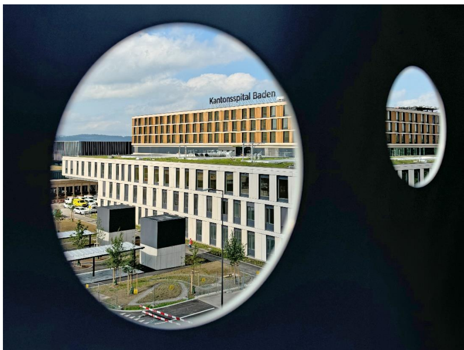
Ein Schweizer Gemeinschaftswerk: der KSB-Neubau mit seinen drei Bettengeschossen (Holzfassade).

Mit der Ausschreibung für das Mobiliar hat das Kantonsspital Baden seine letzte von insgesamt 250 öffentlichen Vergaben publiziert. Der 580 Millionen Franken teure Neubau generierte eine hohe lokale Wertschöpfung: 97 Prozent der 177 am Neubau beteiligten Firmen stammen aus der Schweiz, vorwiegend aus den Kantonen Aargau und Zürich.